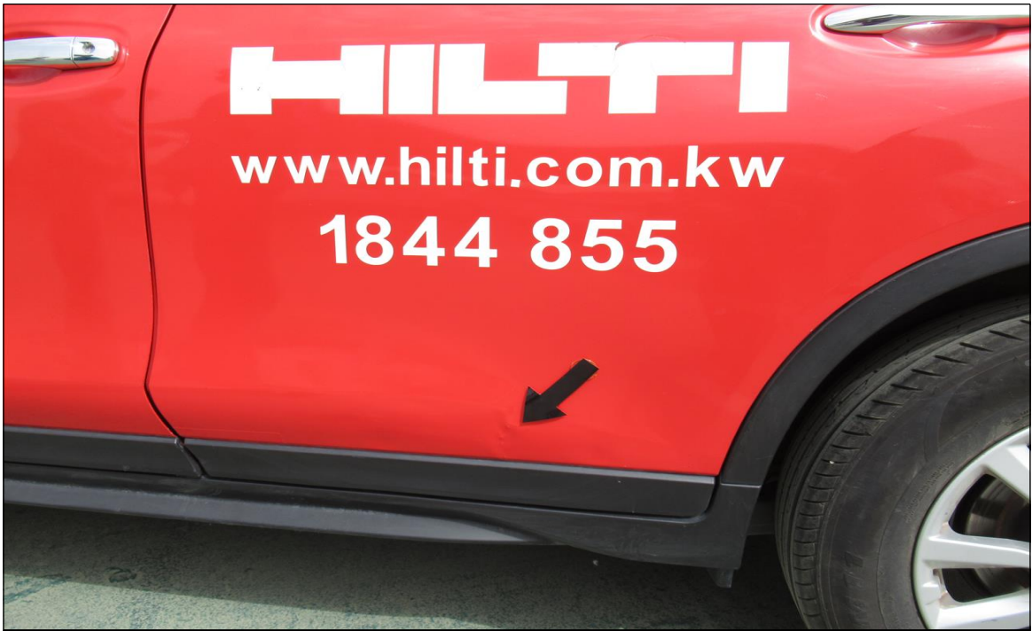
PHOTO -19 IMPORTANT DAMAGE 3