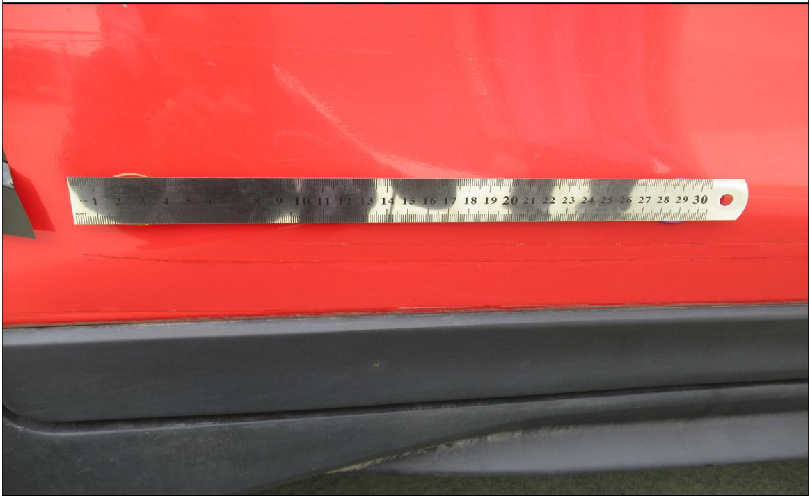
PHOTO -18 IMPORTANT DAMAGE 2