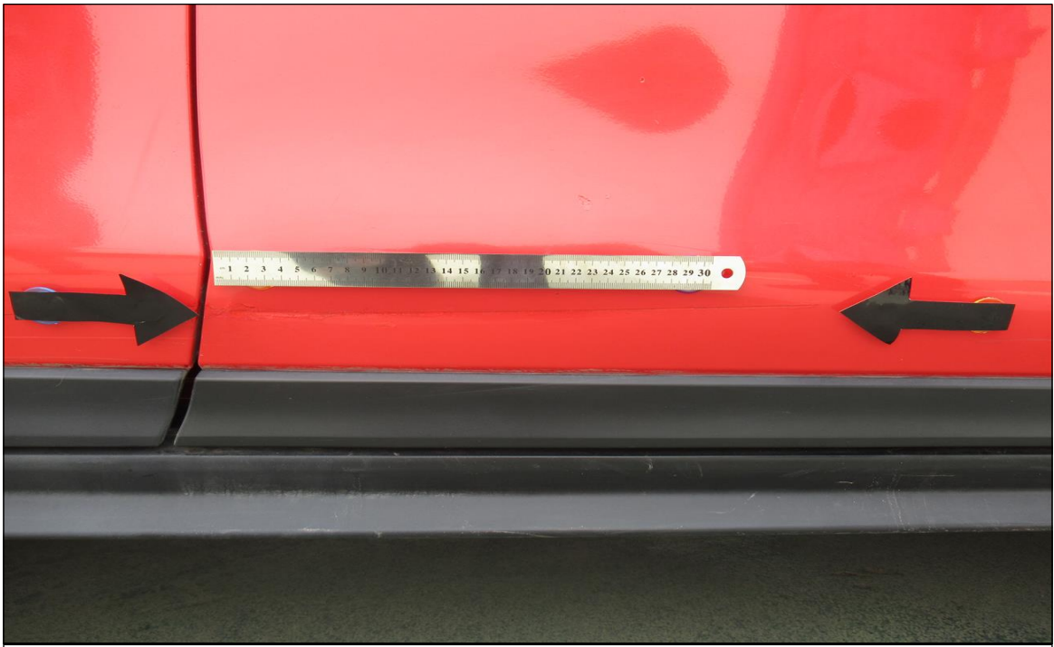
PHOTO -17 IMPORTANT DAMAGE 1